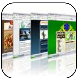
Gráfico Web Multimedia