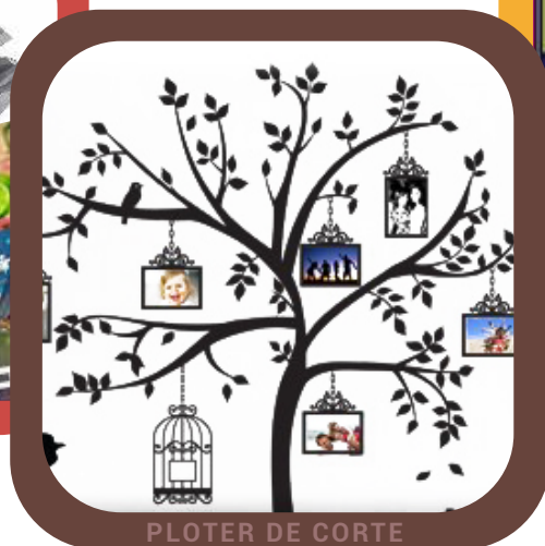
PLOTER DE CORTE