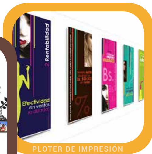
PLOTER DE IMPRESIÓN